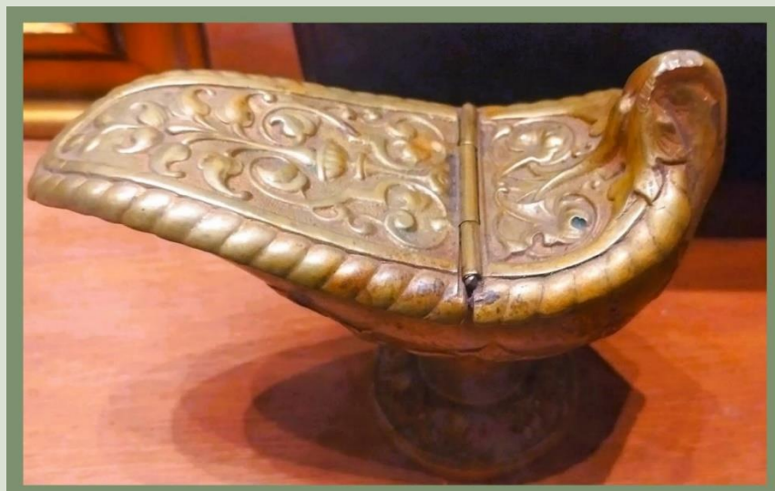
Pequeño incensario portátil labrado en bronce con motivos florales (siglo XIX). Museo Sacro de Viesca.

La fundación de la Provincia de Nueva Vizcaya en el siglo XVI planteó otras rutas evangelizadoras que llevarían al descubrimiento de lo que hoy es la Comarca Lagunera. Como parte de este proceso fue el célebre franciscano fray Pedro de Espinareda