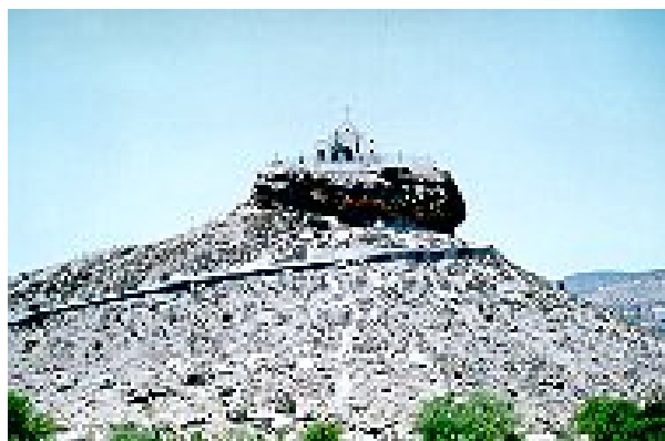
Capilla del Santo Madero de Parras

Estos ex-votos narran , por decirlo así, hechos cuyo desenlace era percibido como una intervención salvífica, eminentemente sobrenatural que no fluye directamente de Dios sino, de manera indirecta, a través de la reliquia taumaturga: el Santo Madero o Santa Cruz.