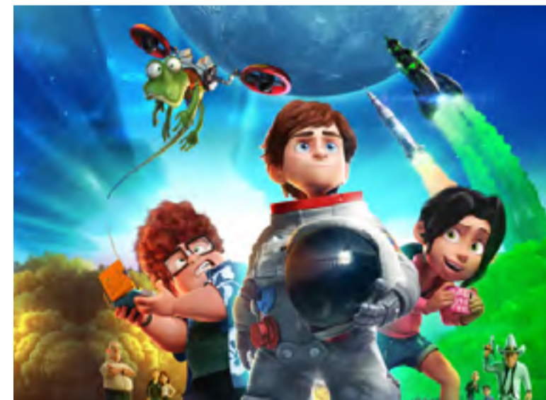
Una familia espacial de Enrique Gato (España, 2016, 97 min, clasificación: A)

A la luz de este documento pontificio recomiendo una serie de películas con el tema de la familia en su diversidad, con sus luces y sombras, con sus alegrías y retos. Son películas de diferentes géneros, épocas y nacionalidades. Algunas las podemos ver en familia con los niños (clasificación A), otras son para adolescentes y adultos (clasificación B). Invito a verlas con apertura y con una mirada que quiere reconocer lo humano que hay en cada historia.