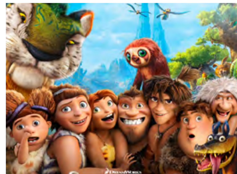
Los Croods de Chris Sanders y Kirk DeMicco (E.U., 2013, 98 min., clasificación: A)

La cinta cuenta la historia de Mike Goldwing, un surfista de 12 años de edad, hijo y nieto de astronautas, cuya familia está separada a raíz de un incidente que ocurrió años atrás. Para impedir que se lleve a cabo un plan malvado del millonario Richard Carson de colonizar la luna y explotar sus recursos, Mike deberá embarcarse en un viaje por el espacio con su abuelo y amiga Amy. Este viaje espacial se convertirá también en un viaje al interior que ayudará a los protagonistas a restaurar la comunicación y el amor en la familia. “La comunión familiar puede ser conservada y perfeccionada sólo con un gran espíritu de sacrificio. Exige, en efecto, una pronta y generosa disponibilidad de todos y cada uno a la comprensión, a la tolerancia, al perdón, a la reconciliación”, nos dice el Papa en el no. 106. Veamos cómo nuestro héroe Mike surfea en el mar, en el espacio y en la familia con estos valores.