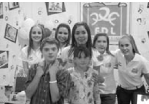
Entusiastas alumnos presentaron sus propuestas durante el evento Retos del Mercado 2005.

Comercio exterior y aduanas Comunicación Diseño Gráfico Ingeniería industrial Los ganadores en retos del mercado 2005