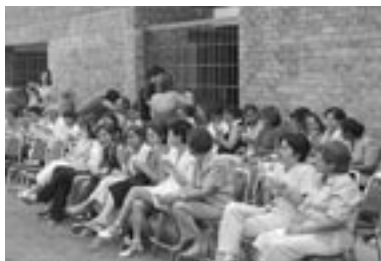
Las mamás Ibero disfrutaron de un convivio organizado por la Dirección de Personal.

Finalmente, en los jardines laterales de la capilla se llevó a cabo la convivencia donde se sirvió nieve, pastel y refrescos. La rondalla de la Universidad cautivó a las mamás con sus canciones románticas y la dedicación de lindas frases de poesía. Festejar este día tan especial para las mamás permite fomentar la integración de quienes trabajamos en la Universidad.