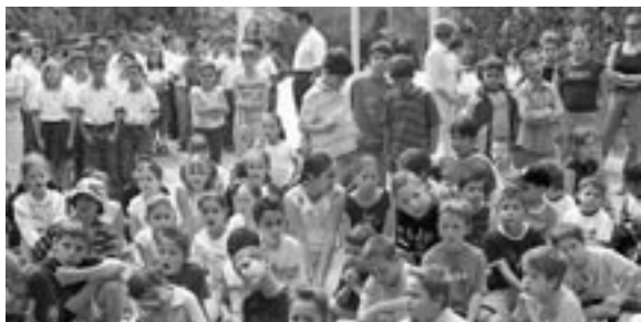
Niños de diversas escuelas visitaron la exposición Alma mía de Cocodrilo.

Mención Honorífica: Sistema de Alta Eficiencia Energética (Ahorro por calen- tamiento de agua)