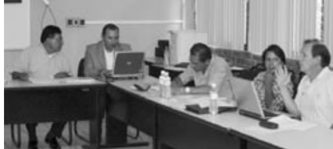
Siguen los preparativos para el Encuentro Deportivo del Sistema Universitario Jesuita

El pasado 7 de mayo se reunieron 20 ex - alumnos, ex presidentes de las Sociedades de Alumnos de la UIA Laguna en un desayuno en conocido restaurante de esta ciudad. El objetivo de la reunión fue tener un acercamiento con los egresados de esta institución y buscar un contacto más cercano y continuo con ellos, sobre todo para seguir ofreciéndoles las diversos beneficios que tienen como egresados: diplomados, maestrías, conferencias y otros eventos más.