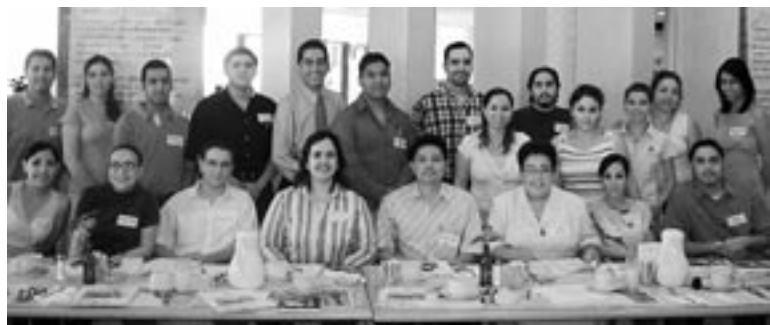
Nutrido grupo de egresados de distintas carreras se dieron cita en el desayuno organizado por la Oficina de Exalumnos.