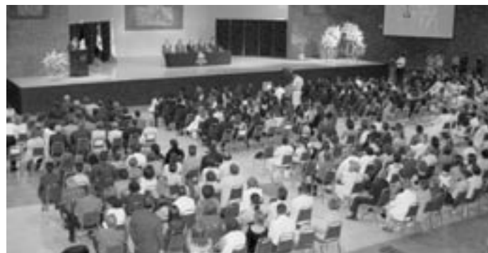
El auditorio de la UIA Torreón se vistió de gala durante la Ceremonia de Egresados Primavera 2005.

En el curso participaron personal de la Universidad, miembros del patronato económico PREDELAC, de la Escuela Carlos Pereyra y de la Fundación David Hernández García.