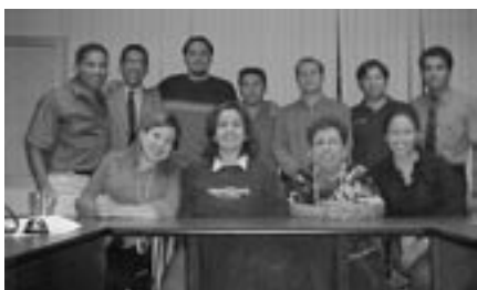
Mesa directiva de la nueva A.C. de exalumnos UIA Laguna.

Gracias a la participación y compromiso de profesionistas egresados de la Universidad Iberoamericana Laguna, se sentaron las bases para la constitución de la asociación