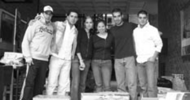
Alumnos de distintas carreras que participaron en el acopio de alimentos.