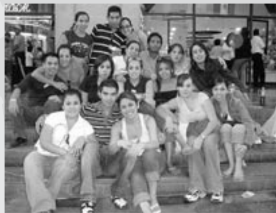
Alumnos que asistieron a la ANERI 2005.

Para el comité organizador del evento y para la Coordinación de la Licenciatura en Relaciones Industriales será una gran oportunidad para demostrar que podemos ser sede de un evento de esta magnitud. La realización del Congreso involucrará a toda la carrera de Relaciones Industriales y a la Comunidad Ibero en general. Trabajamos ya para ofrecer un Congreso de primer nivel. Hoy, mañana y siempre en la Licenciatura en Relaciones Industriales estaremos de fiesta .