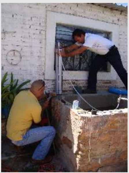
Filtro para agua potable.

La Ibero fue sede del Taller de capacitación y manejo de centros de acopio de la Red universitaria para la Prevención y Atención de Desastres (Unired). El objetivo de la Unired es fomentar en la población la cultura de prevención frente a los fenómenos naturales, así como organizar la respuesta adecuada y articulada de la sociedad civil ante la ocurrencia de un desastre, así como coordinar las acciones de las universidades públicas y privadas de México para prevenir y responder de forma organizada y eficaz ante la ocurrencia de un evento extraordinario. La Unired está conformada por más de 150 campus de educación superior de México, divididos en 10 regiones, que se coordinan y articulan para llevar a cabo sus actividades de prevención y ayuda humanitaria en caso de algún desastre.