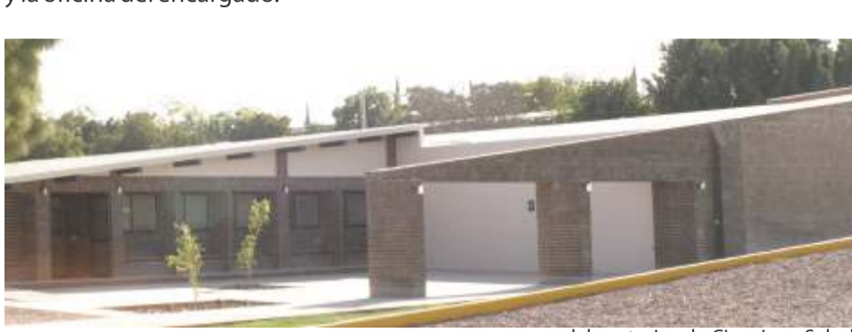
laboratorios de Ciencias y Salud

Se llevó a cabo la inauguración del laboratorio de Ciencias y Salud que se encuentra instalado en Edificio C, a un costado de la capilla San Francisco Javier. El proyecto se realizó cubriendo todas las necesidades y requerimientos que demanda la nueva licenciatura en Nutrición y Ciencias de los Alimentos, que entre sus actividades se encuentran el desarrollo de nuevos productos, participación en políticas públicas en relación al tema alimentario, la orientación y la educación en nutrición, la administración de servicios de alimentación, entre otros.