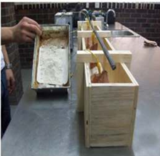
Remoción del arsénico en fluorita.

La Ibero fue sede del Taller de capacitación y manejo de centros de acopio de la Red universitaria para la Prevención y Atención de Desastres (Unired). El objetivo de la Unired es fomentar en la población la cultura de prevención frente a los fenómenos naturales, así como organizar la respuesta adecuada y articulada de la sociedad civil ante la ocurrencia de un desastre, así como coordinar las acciones de las universidades públicas y privadas de México para prevenir y responder de forma organizada y eficaz ante la ocurrencia de un evento extraordinario. La Unired está conformada por más de 150 campus de educación superior de México, divididos en 10 regiones, que se coordinan y articulan para llevar a cabo sus actividades de prevención y ayuda humanitaria en caso de algún desastre.