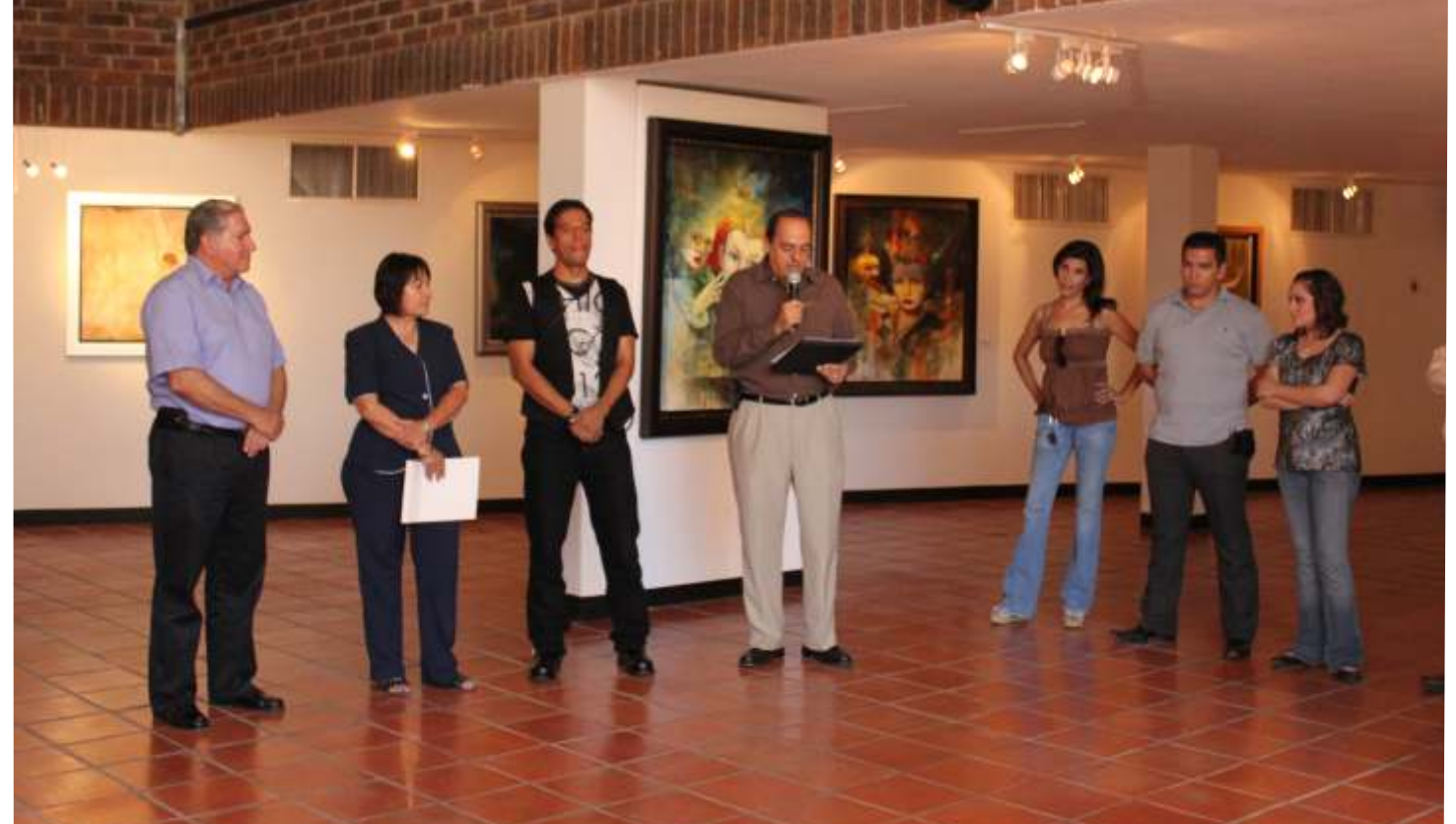
Inauguración de la exposición de 'La intensidad desde mi alma'