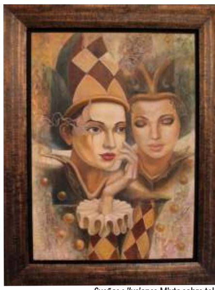
Sueños e Ilusiones. Mixta sobre tela.