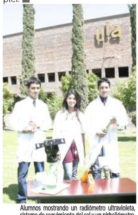
Alumnos mostrando un radiómetro ultravioleta, sistema de seguimiento del sol y un pinhelómetro.