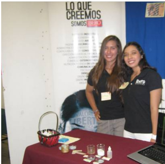
En las fotos

Los 3 proyectos son para pilas solares recargables con el sol.